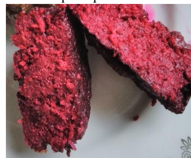
Biešu pudiņš šķērsgriezumā