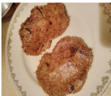
Cepti uz pannas